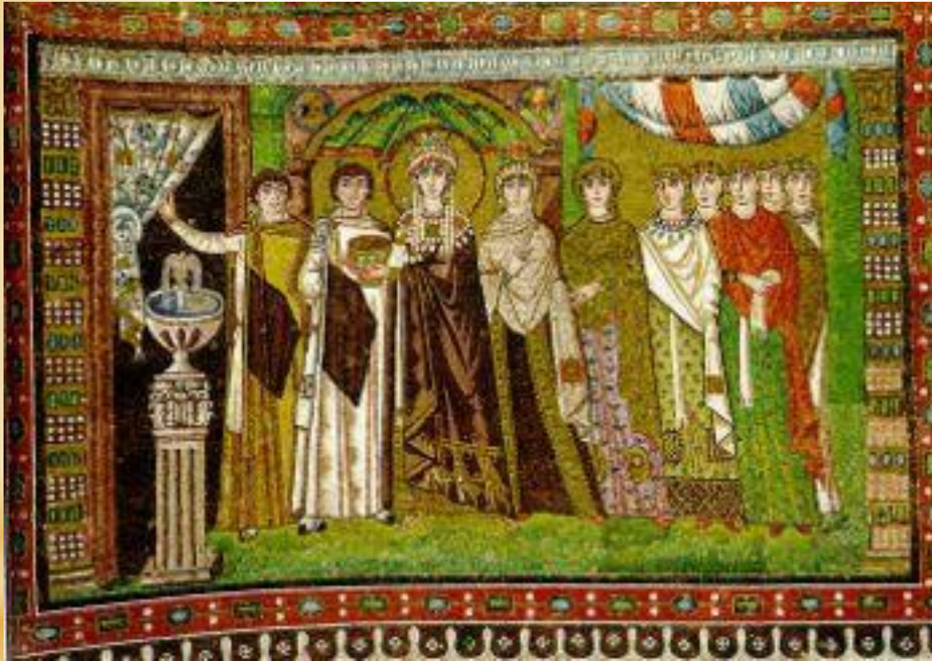
San Vitale a Ravenna L'Imperatrice Teodora